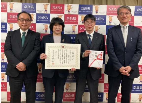
奈良県庁で行われた感謝状贈呈式