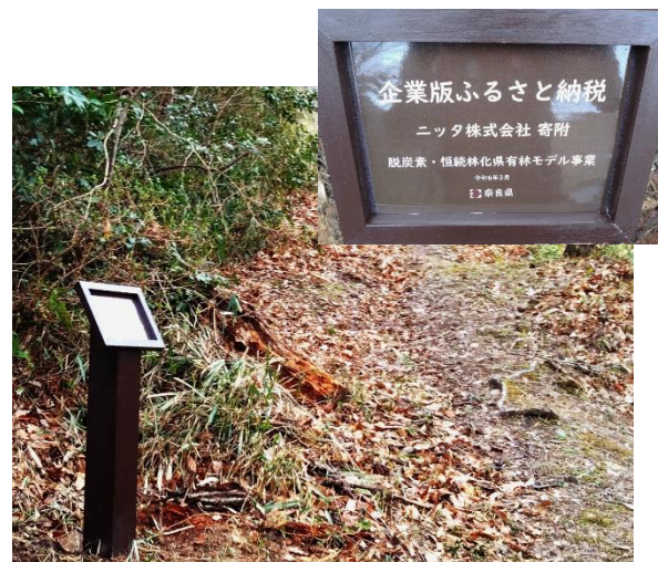
遊歩道脇のプレート（2024年3月撮影）