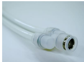
ワンタッチ継ぎ手