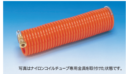
写真はナイロンコイルチューブ専用金具を取付けた状態です。

コイル復元力に優れ、伸び癖が付き難いコイルチューブです。 耐圧性能と耐熱性能に優れています。