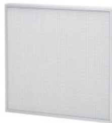
パネル型 HEPA フィルタ「SPleats™」