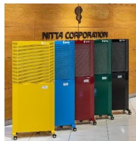
[カラー指定もオプション対応可能です]