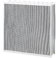
[酵素 HEPA フィルタ] ※オプション