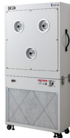
[パンカールーパー仕様]