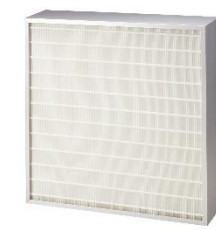
[超高性能フィルタ micro EMILENT™]