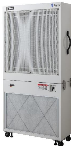
[パンチングフェース仕様]