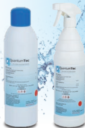
エアゾール バックインボトル