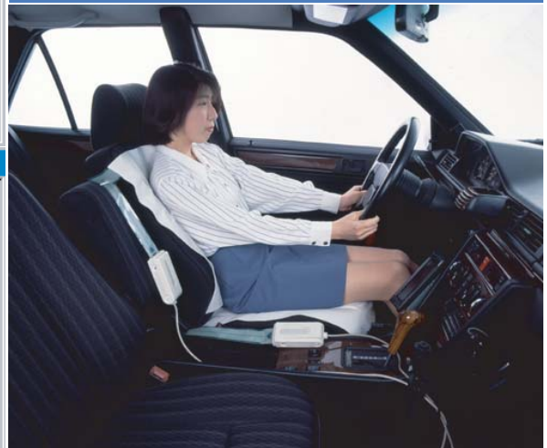
シート面圧の測定例